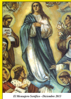
El Mensajero Seráfico - Diciembre 2013